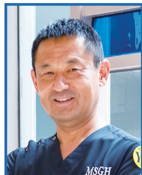
社会医療法人 製鉄記念八幡病院 循環器内科部長

正常な脈以外のものを不整脈と言います。大きく3つに分けて、脈拍数が100回／分以上になる「頻脈性不整脈」（心電図B参照）、50回／分以下になる「徐脈性不整脈」（心電図C参照）、タイミングのずれた脈が出る「期外収縮」（心電図Dの青★）があります。「徐脈性不整脈」はペースメーカー治療が必要になる場合があります。不整脈の発症は加